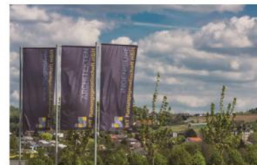
Gewerbegebiet Ruckelshausen / Mühlthal