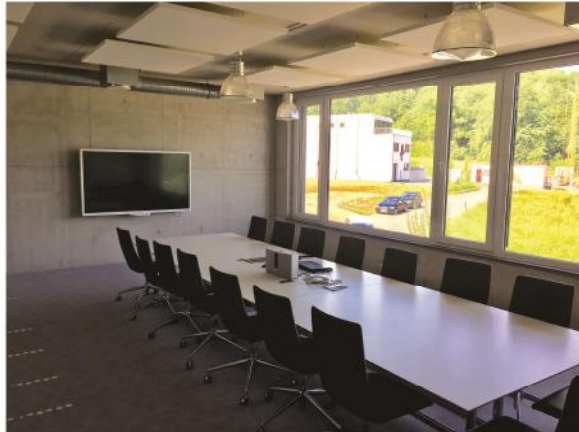
Mit Blick in die Natur: Der Konferenz- und Veranstaltungsraum der IHT Planungsgesellschaft soll zukünftig auch für Schulungen genutzt werden

Impressum: IHT Planungsgesellschaft mbH Am Kloßberg 10 64367 Mühlthal Newsletter abbestellen