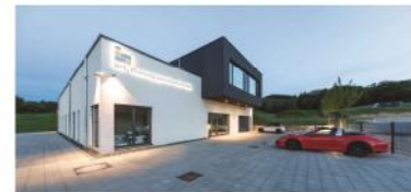
IHT Office Mühlthal

Die sehr kurze Bauzeit für die Größe des Gebäudes (Spatenstich 01.03.2016, Rohbaufertigstellung 31.07.2016, Einzug 11.11.2016) war durchaus eine Herausforderung, konnte aber mit viel Herzblut, persönlichem Engagement und sehr guter Arbeit der ausführenden Firmen bauzeit- und kostentechnisch optimal realisiert werden. Bei dieser Gelegenheit wollen wir uns noch einmal bei allen Beteiligten bedanken, die uns dabei geholfen haben, das Projekt „IHT Office Mühlthal“ so erfolgreich umzusetzen.