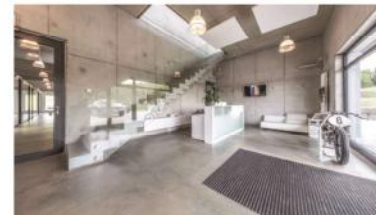
Foyer / Eingangsbereich